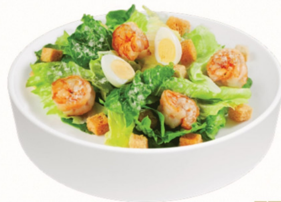
ЦЕЗАРЬ С КРЕВЕТКАМИ

КУРИЦА, ПАРМЕЗАН, САЛАТ РОМАНО, САЛАТ АЙСБЕРГ, ПЕРЕПЕЛИНОЕ ЯЙЦО, ГРЕНКИ, СОУС ЦЕЗАРЬ