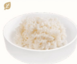
РИС НА ПАРУ