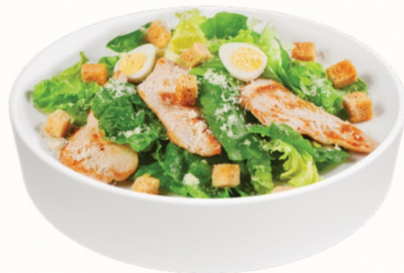
ЦЕЗАРЬ С КУРИЦЕЙ

ГРЕБЕШОК, КРЕВЕТКИ, АВОКАДО, ТОМАТЫ ЧЕРРИ, САЛАТНЫЙ МИКС, ФРУКТОВАЯ ЗАПРАВКА