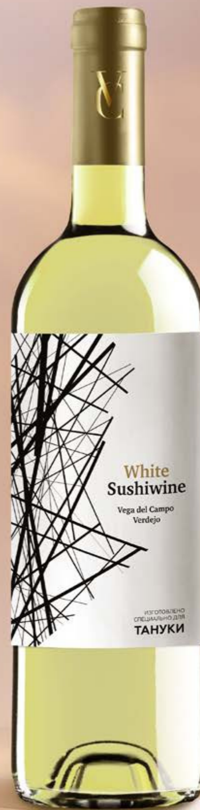
WHITE SUSHIWINE VERDEJO сухое

ПРЕЗЕНТОВАНО В РАМКАХ ПРОГРАММЫ «ТАНУКИ»